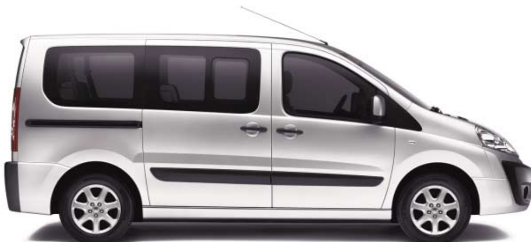
Prikazana izvedba: Kratki (L1)

Novi Expert Tepee nudi vam izbor između nekoliko izvedbi. Među njima možete pronaći onu koja vam najbolje odgovara, koja najbolje odražava vašu osobnost i najbolje je prilagođena vašim potrebama i načinu uporabe.