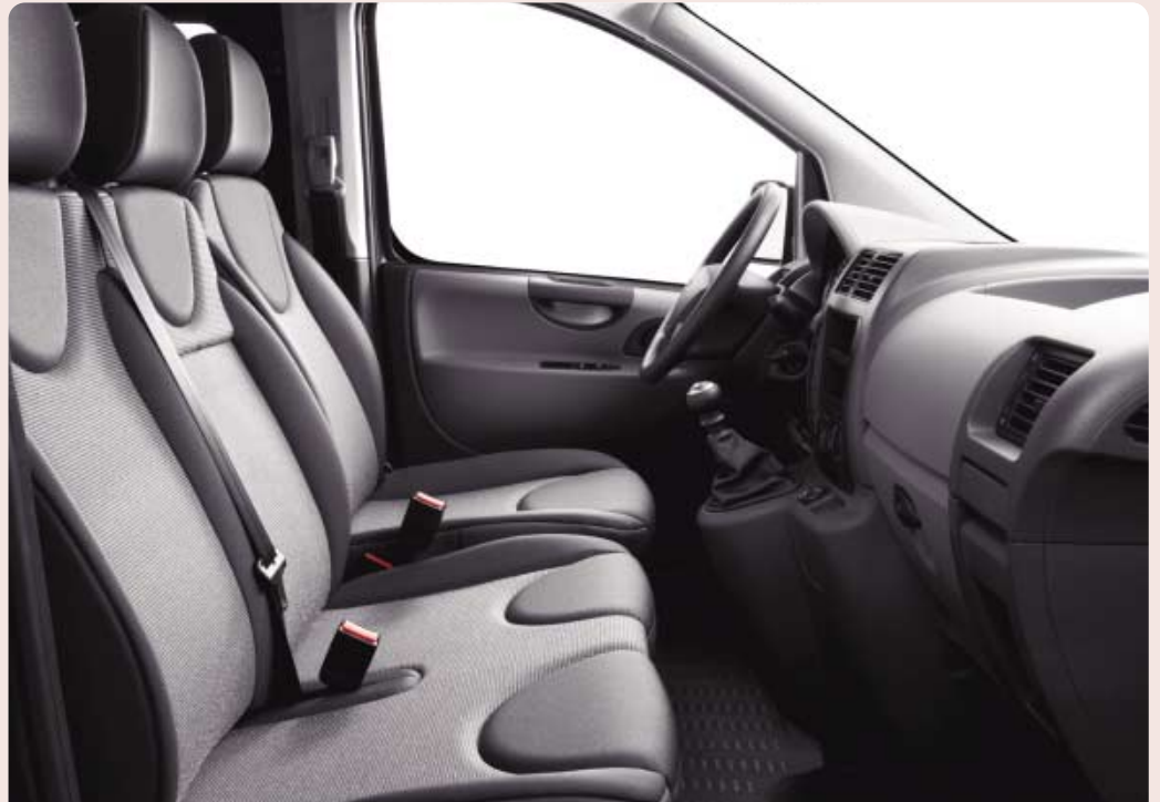
Opletana tkanina : Transcodage narbonnais