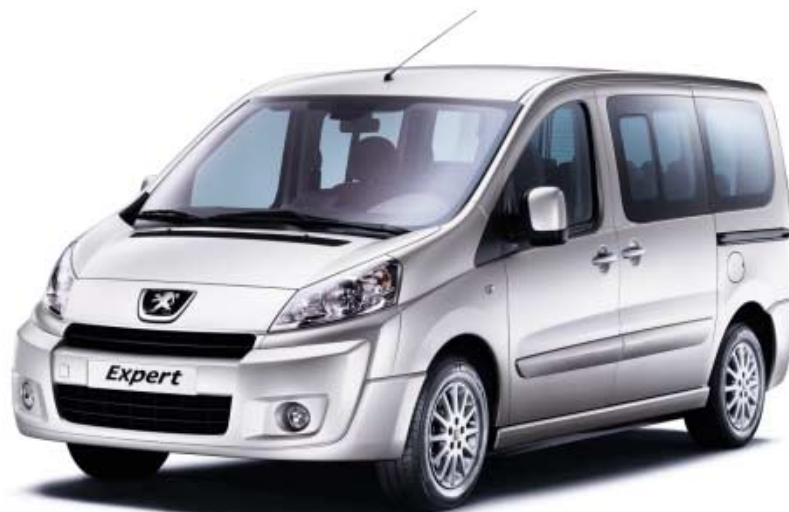
Aluminijski naplatci u opciji Prikazana izvedba: Kratki (L1), model dostupan samo u izvedbi Dugi (L2)