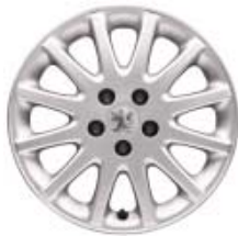
Naplatak od lake legure "Vivace" 16"