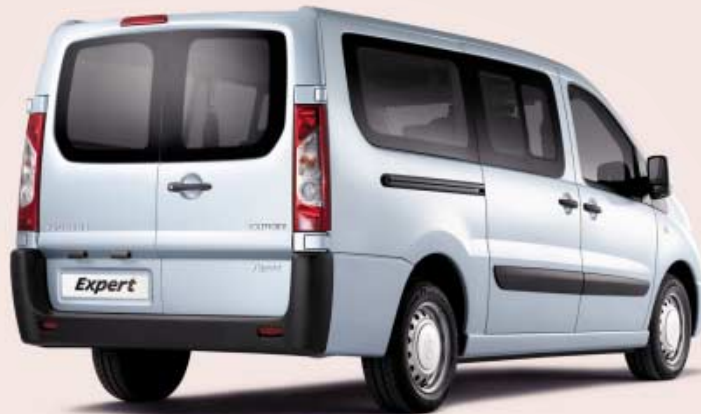
Prikazana izvedba: Dugi (L2)