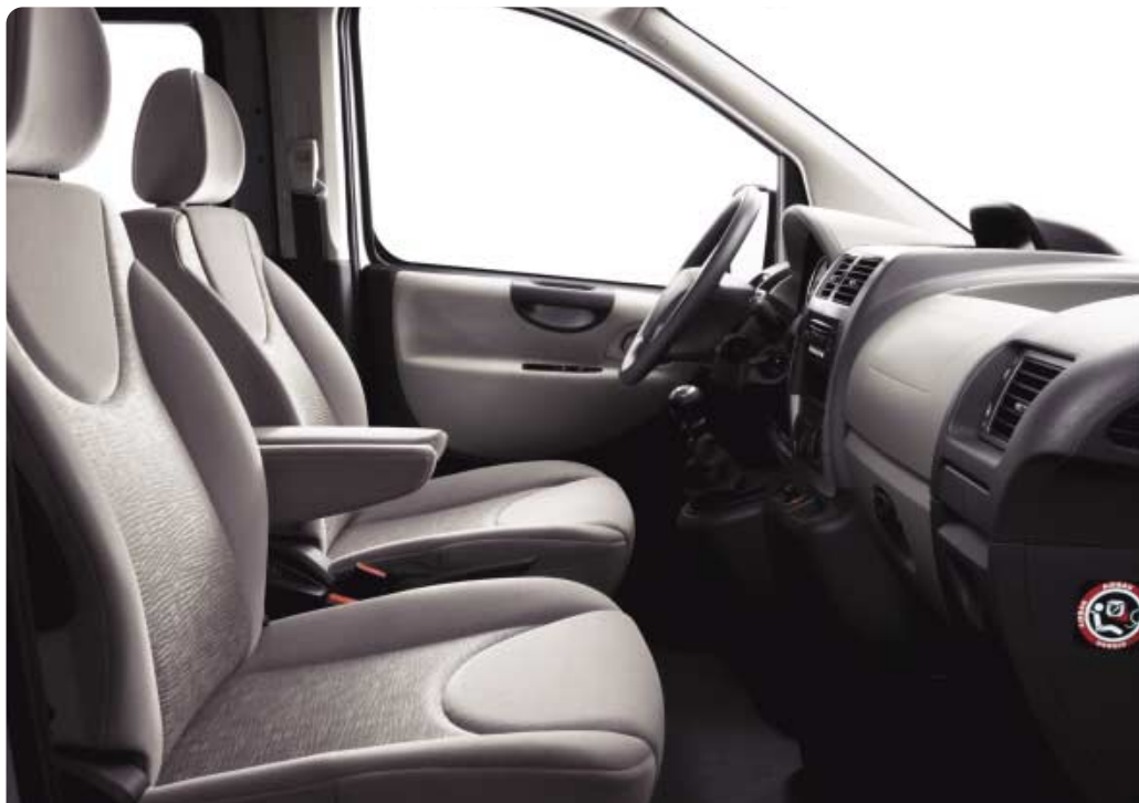
Opletena tkanina : Mikado i velur Misteko grège