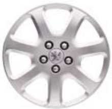
Ukrasni poklopac "Novae" 16"