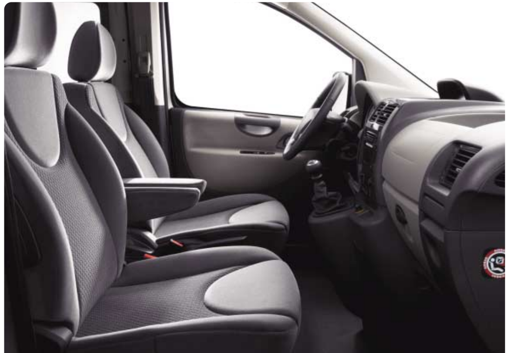
Siva Narbonnais/Siva Sirocco i velur Jocaste