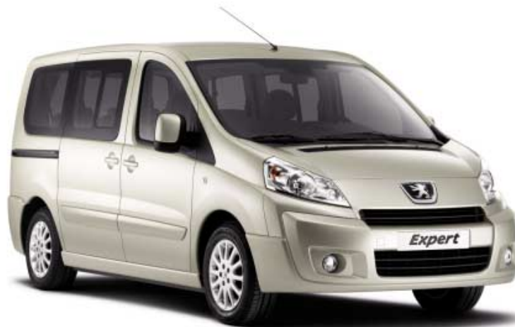
Aluminijski naplatci u opciji Prikazana izvedba: Kratki (L1), model dostupan samo u izvedbi Dugi (L2)