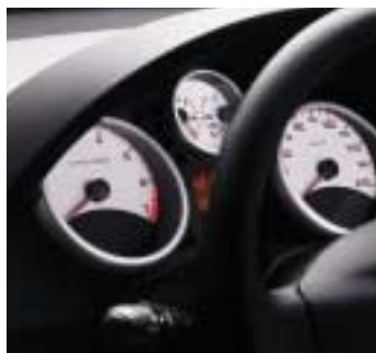
Kontrolna ploča Trendy s 4 instrumenta