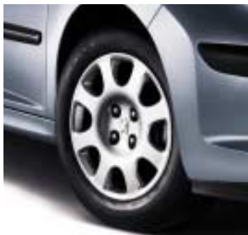
Ukrasni poklopci Auckland 15"