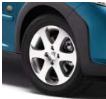
Aluminijski naplatak Outdoor 16"