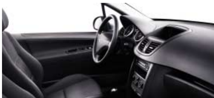
Tkanina Koulikoro cma