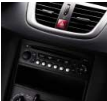
Obloge Siva Lion