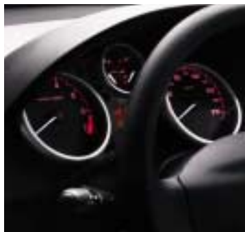
Instrument ploča Urban