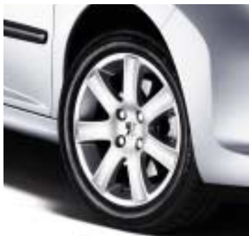
Aluminijski naplatci Spa 16"