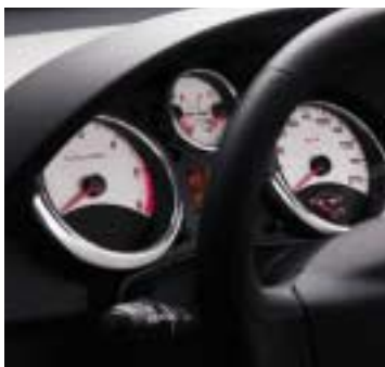
Kontrolna ploča Sporty s 5 instrumenata