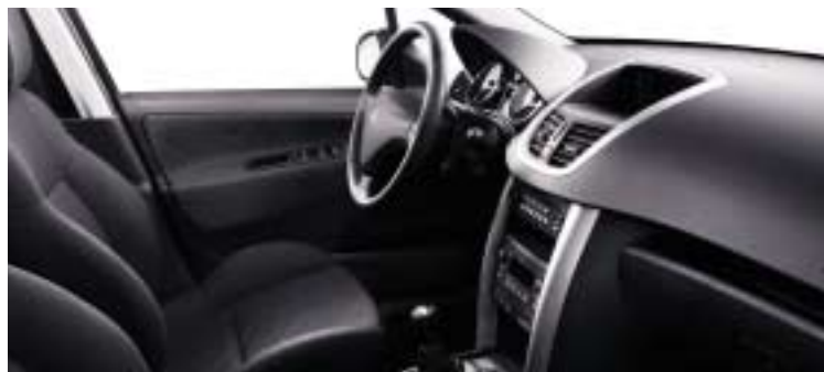
Tkanina Zindal crna/metal