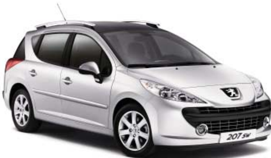
Model na slici prikazan je s opcionalnim krovnim nosačima