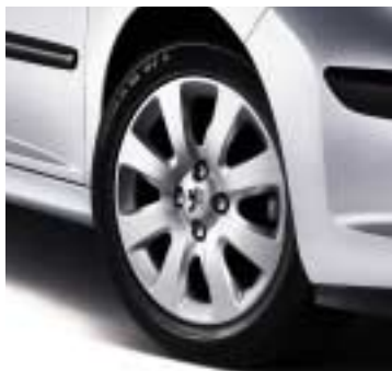
Ukrasni poklopci Hobart 15"