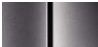
Siva Moondust Dostupno samo za Outdoor