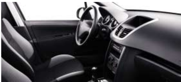
Tkanina Pachinko crna