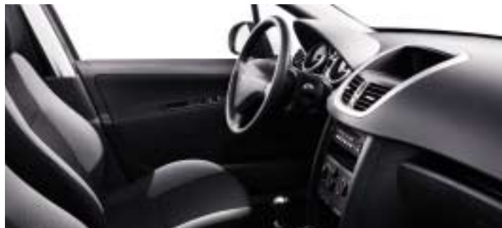
Tkanina Pachinko crna