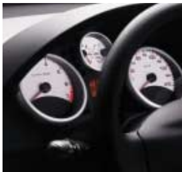
Kontrolna ploča Trendy s 4 instrumenta