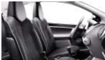
Tkanina Stilada Mistral Bise.

Harmonična unutrašnjost, sa sivom centralnom konzolom i oblogama vratiju, naglašena je specifičnom teksturom sjedala Stilada Mistral dostupnom u dvije boje, ovisno o boji karoserije. Dostupan u izvedbi s tri ili pet vrata.