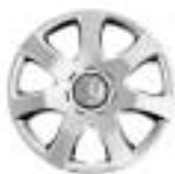
Ukrasni poklopac Cordouan