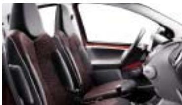
Tkanina Stilada Mistral Orange.