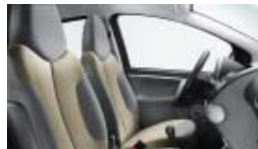
Nokimate bež Sand.

Elegantna unutrašnjost sadrži dvobojnu crno-sivu instrument ploču i sive Bise obloge vratiju. Cijeli je ugođaj posebno naglašen oblogama sjedala u opletenoj tkanini Nokimate Bež Sand ili Crna Mistral, ovisno o boji karoserije. Dostupan u izvedbi s tri ili pet vrata.