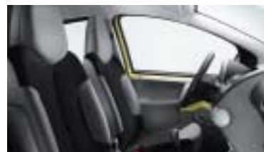
Nokimate crna Mistral.