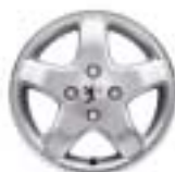
Naplatak od lake legure 14"